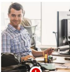
Bad photo setting Too much body. Cluttered workspace.