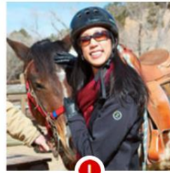
Distracting background Attire is too casual. Eyes covered by sunglasses.