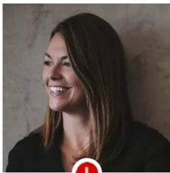
Bad photo composition Not looking at camera. Poor lighting and too dark.